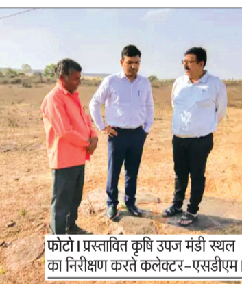
फोटो। प्रस्तावित कृषि उपज मंडी स्थल का निरीक्षण करते कलेक्टर-एसडीएम।

निरीक्षण के दौरान अधिकारियों ने यह भी देखा कि नई मंडी स्थल पर किसानों, व्यापारियों और हम्मालों को किसी प्रकार की परेशानी न हो और भविष्य में मंडी के विस्तार की भी पर्याप्त संभावना बनी रहे।