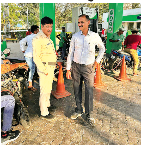
हरिभूमि न्यूज | सिरोंज

गुरुवार को नगर में संचालित पेट्रोल पंपों पर डीजल-पेट्रोल खत्म होने से दिन भर उपभोक्ता डीजल-पेट्रोल के लिए परेशान नजर आए। जैसे ही नागरिकों को डीजल-पेट्रोल न मिलने की सूचना लगी तो पेट्रोल पंपों पर दो पड़िया व चार वाहनों की भारी भीड़ देखने को मिली। वाहन चालक अपने वाहनों में डीजल-पेट्रोल डलवाने के लिए घण्टों लंबी कतार में खड़े हुए। सिरोंज में यदि देखा जाए तो 8 से 10 पेट्रोल पंप संचालित हैं। वहीं गुरुवार को लगभग सभी पेट्रोल पंपों पर डीजल-पेट्रोल खत्म होने की सूचना से दिनभर वाहन चालक अपने वाहनों को लेकर इस पेट्रोल पंप से उस पेट्रोल पंप तक दौड़ते नजर