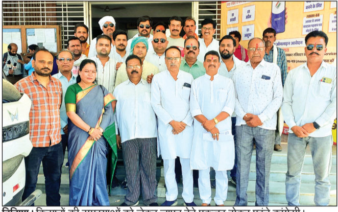
विदिशा। किसानों की समस्याओं को लेकर ज्ञापन देने एकजुट होकर पहुंचे कांग्रेसी।